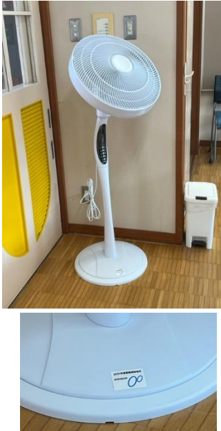
サーキュレーター (大)